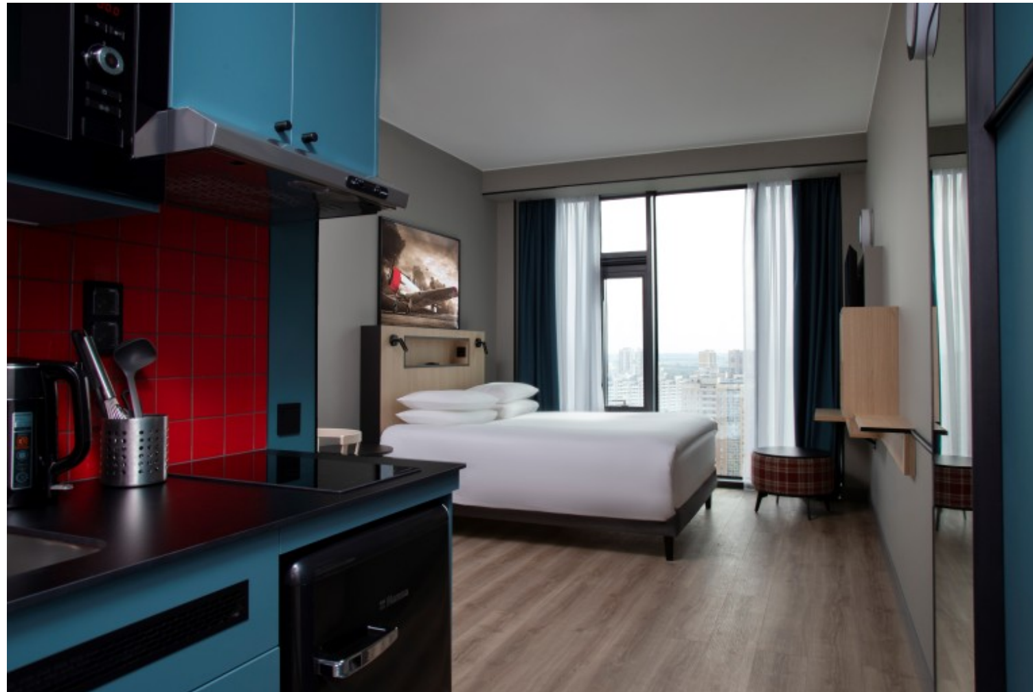
Номер стандартной категории