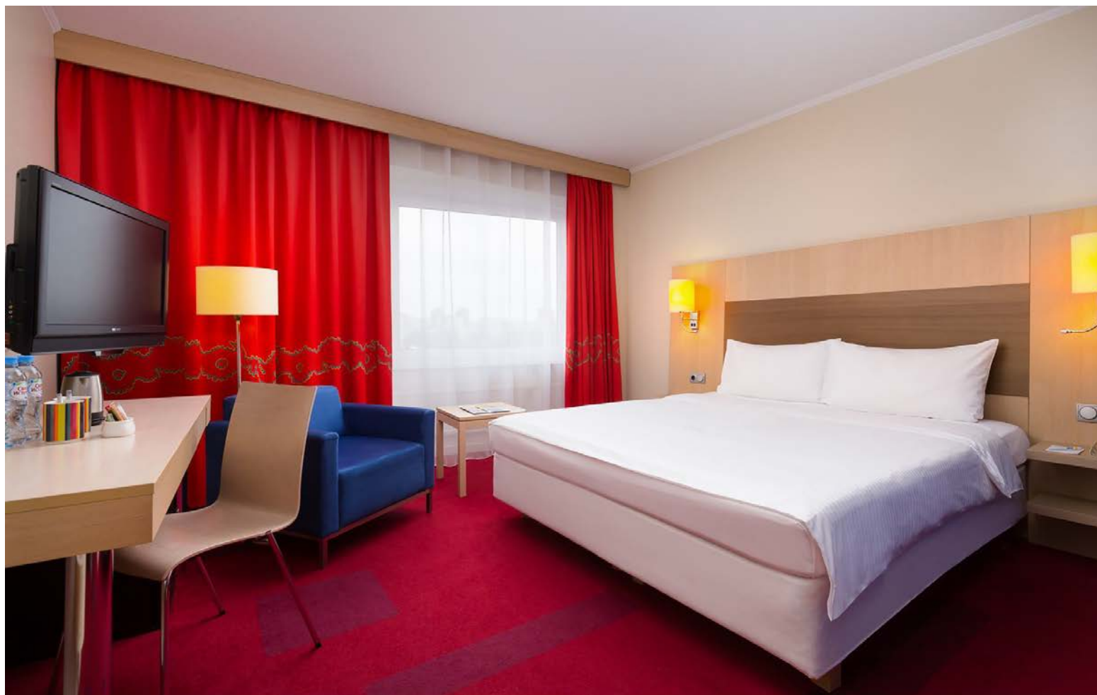
Номер стандартной категории