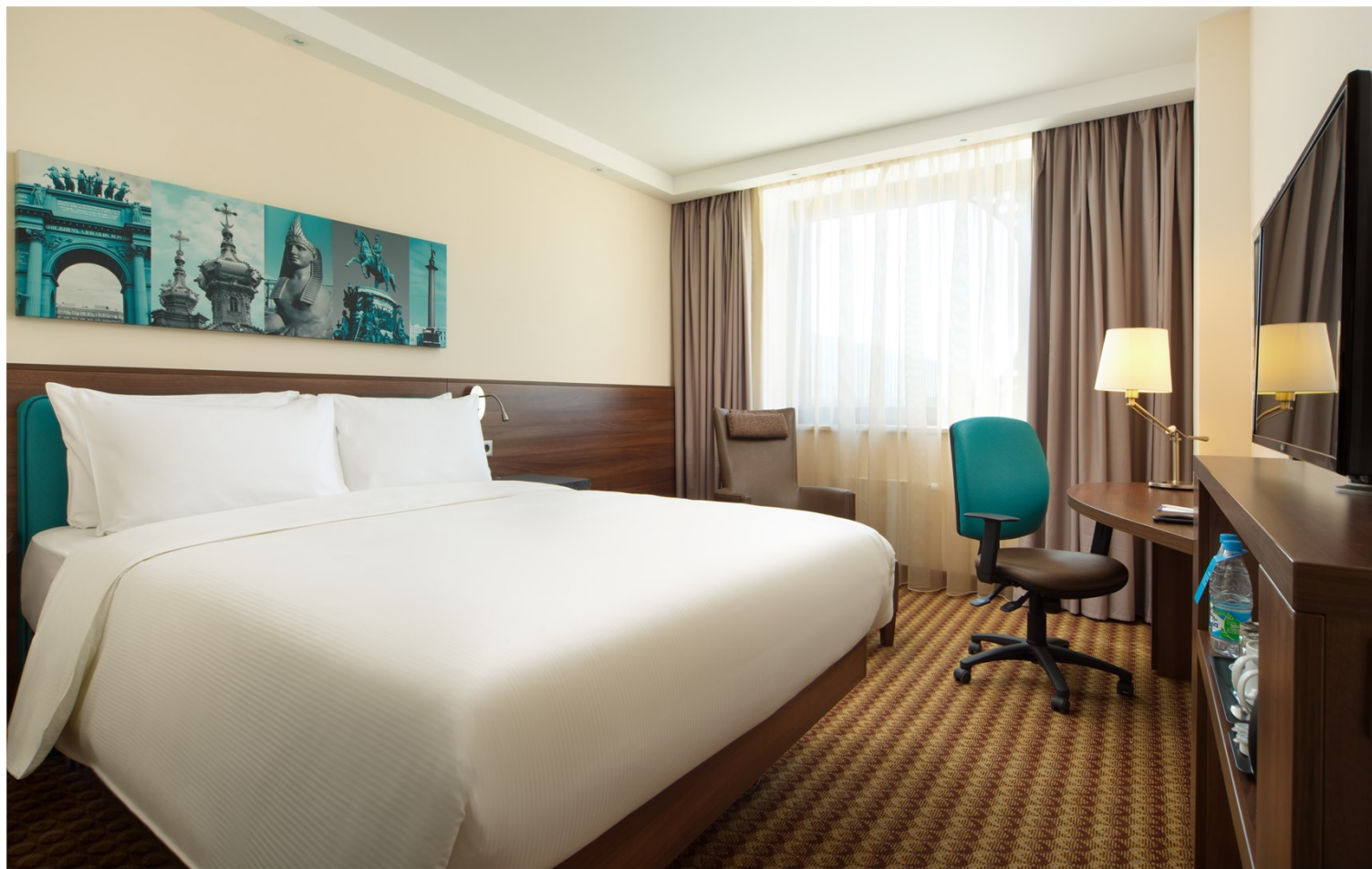
Номер стандартной категории