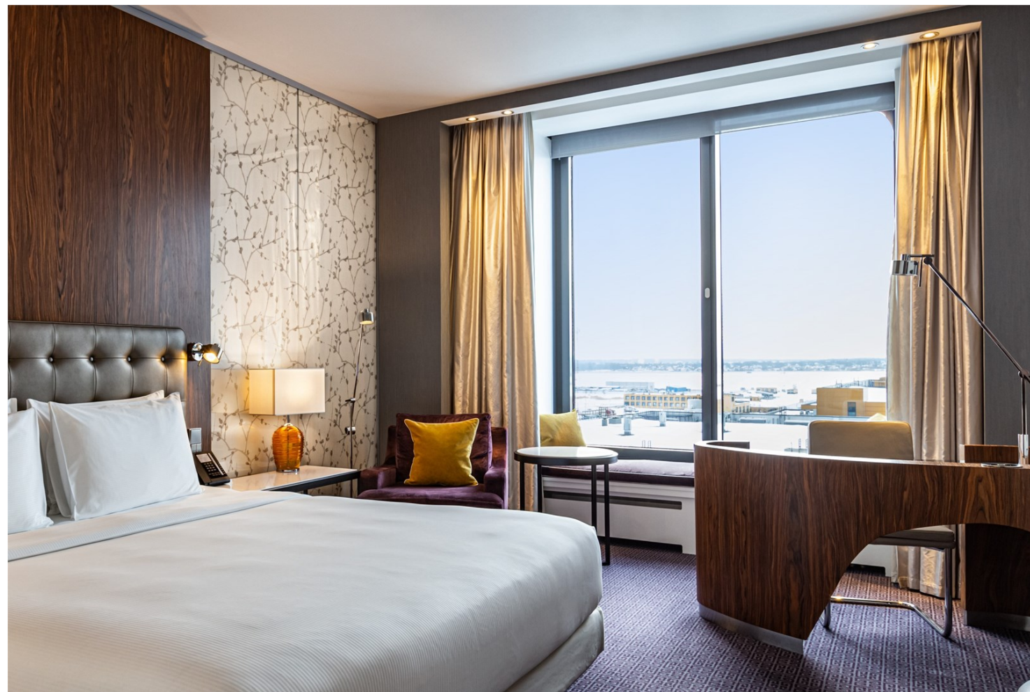
Номер стандартной категории